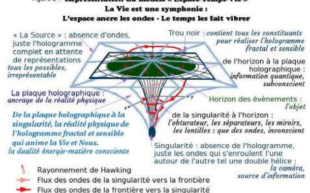
Figure 2 : Représentation du modèle « Espace-Temps-Vie »

L'Univers est la représentation physique de « La Vie » :